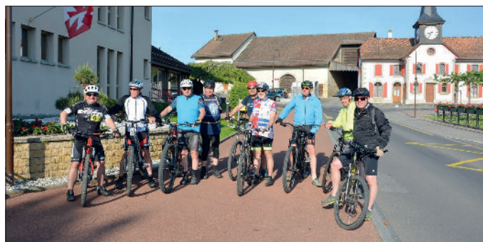
Sortie à Vélos.