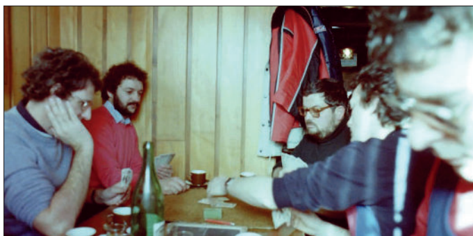
Quelques jeunes en 1984.