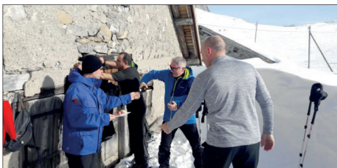
Sortie à Ski.